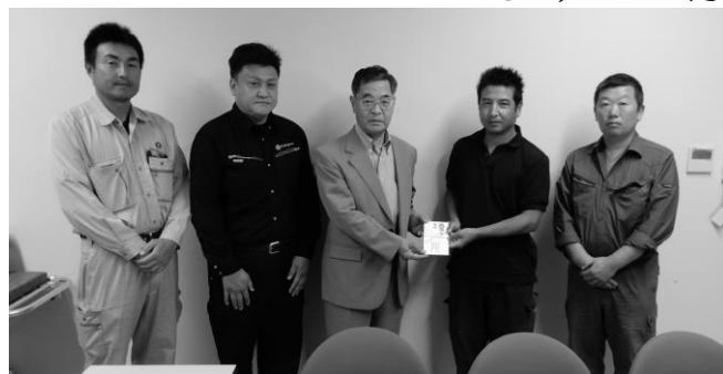
厚木市建設業二世会様等より、厚木あゆまつりに出店し、そこで得た利益から社会福祉のためにと本会にご寄付をいただきました。