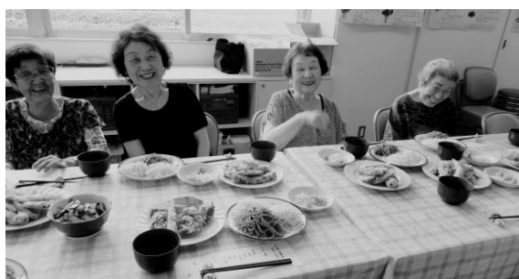
ボリューム満点の天ぷらを前に笑顔の利用者

食後には、コグニサイズの運動で体を動かした後、新聞広告を使ったパズルを全員で行いました。「自分が適当に破った広告を元にもどす」というこのパズル。思っていたよりも難しく、参加者は夢中になって取り組んでいました。