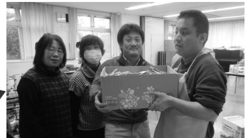
使用済み切手をお届けしました