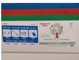
伊豆箱根グループ