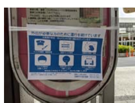
関東バス・武蔵野市