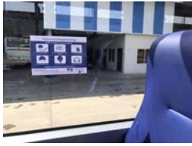
ブノンペン市営バス