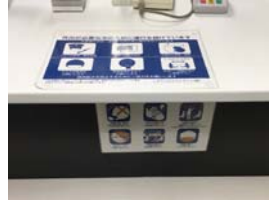
しずてつジャストライン