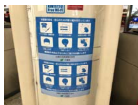
三重県・近畿日本鉄道