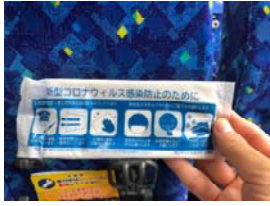
高山市・濃飛バス