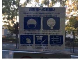
名古屋タクシー協会