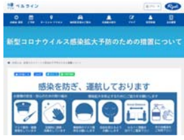
津エアポートライン