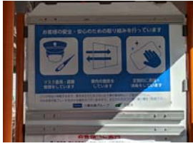
三重県・三重交通